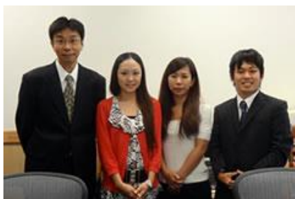
米軍嘉手納基地海軍支店