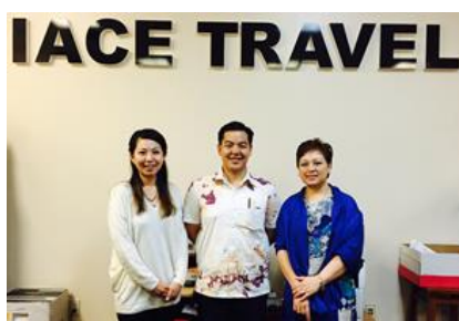
米軍キャンプフォスター支店