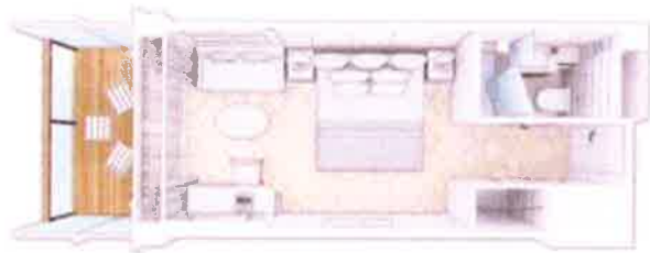
ブリタニア・クラブ・バルコニー・ステートルーム：内装とフロアプラン