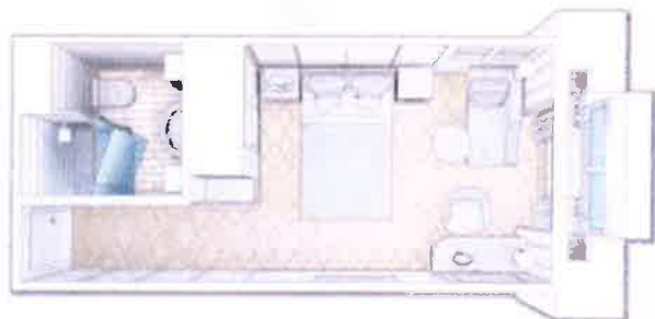
ブリタニア・シングル・ステートルーム（デッキ2）：内装とフロアプラン