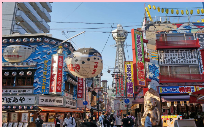
※利用写真はイメージです

《コース内容（モデル料金/2019年8月現在）※貸切観光バスの通行料金は含まれておりません。》